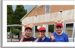
30代・キツネダンス