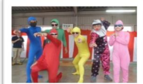
20代・オヤサイジャー