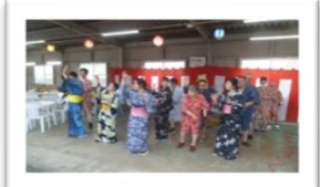
40代・マツケンサンバ