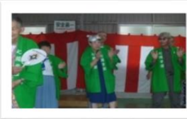
70代・お祭りマンボ