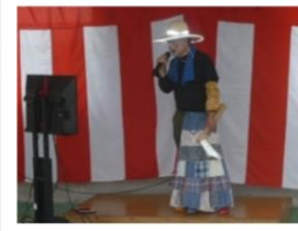
職員によるオヨネーズ『麦畑』