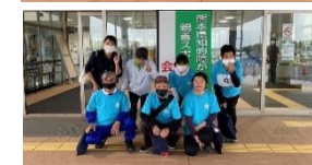
10/8 (日) 植木中央運動公園施設