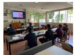
実効性のあるBCP策定と訓練実施方法に関する研修会

オンデマンドにより虐待防止研修会 (8月～9月) や意思決定支援研修会 (10月～11月) や防災訓練 (実地) などを実施