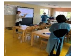
熊本市保健所より新型コロナウイルス感染症への理解促進講習会 (4/24・4/27)